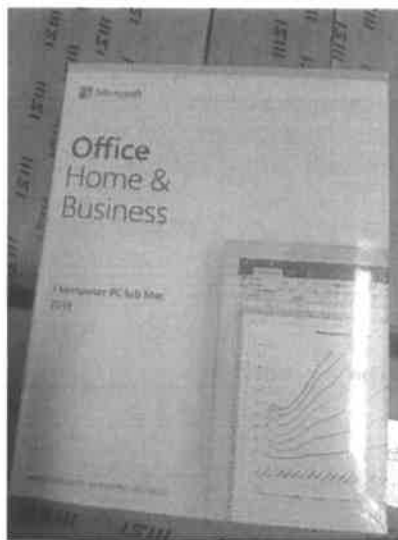
Rys. 3 Przykładowe zdjęcie pudełka dla produktu Microsoft Home&Business

Jesteśmy przekonani, że dzięki takiemu zapisowi do wzoru umowy Zamawiający otrzyma od potencjalnego Wykonawcy w pełni oryginalne oprogramowanie zgodne z warunkami licencjonowania producenta oprogramowania.